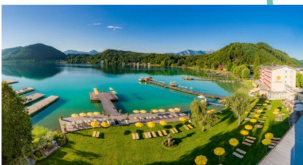
Hotel & Spa Sonne**** am Klopeiner See Autumn Day Spa und Pilates