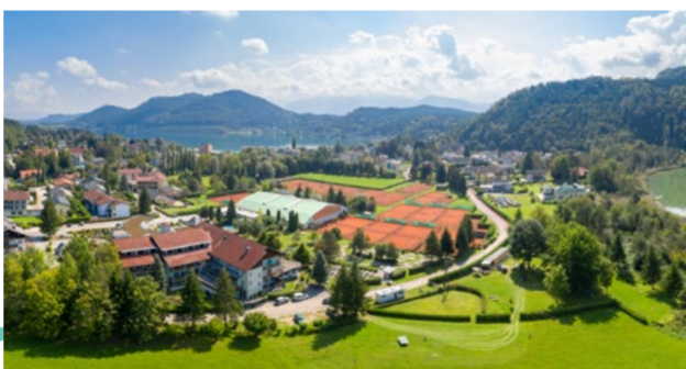
Golf, Tennis- und Wellnesshotel Mori**** Herbstwellness mit Vital-Frühstück