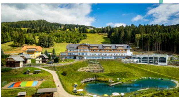
Familotel Petschnighof**** Almspa im Sonnenort Diex